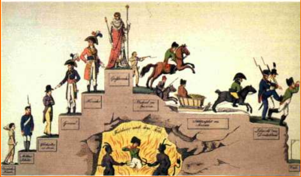
Napoleons Lebenslauf. Kolorierte Radierung nach einer deutschen Karikatur aus der Zeit nach der Völkerschlacht bei Leipzig