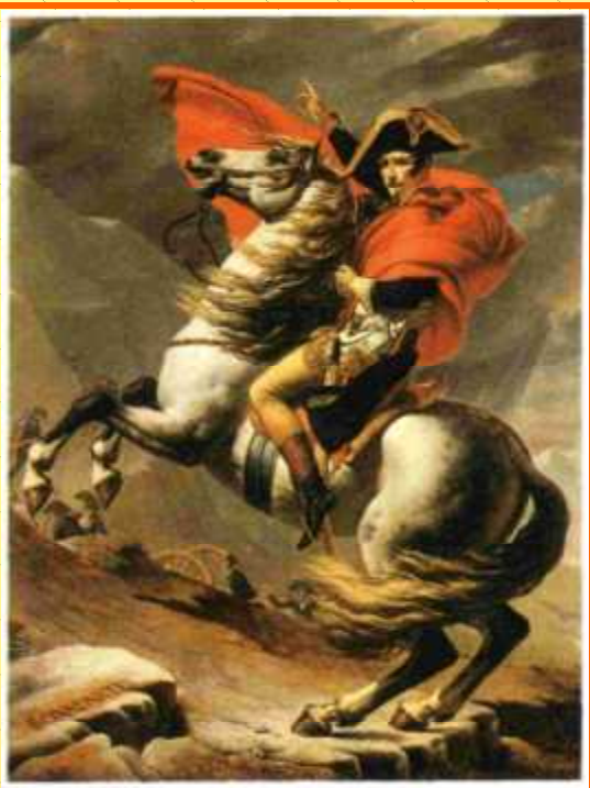
Napoleon übersteigt den Großen St. Bernhard-Paß 1800. Gemälde von J. L. David, einem ehemaligen Jakobiner, der in Napoleon den Vollender der Revolution sah und von diesem zum Hofmaler ernannt wurde.