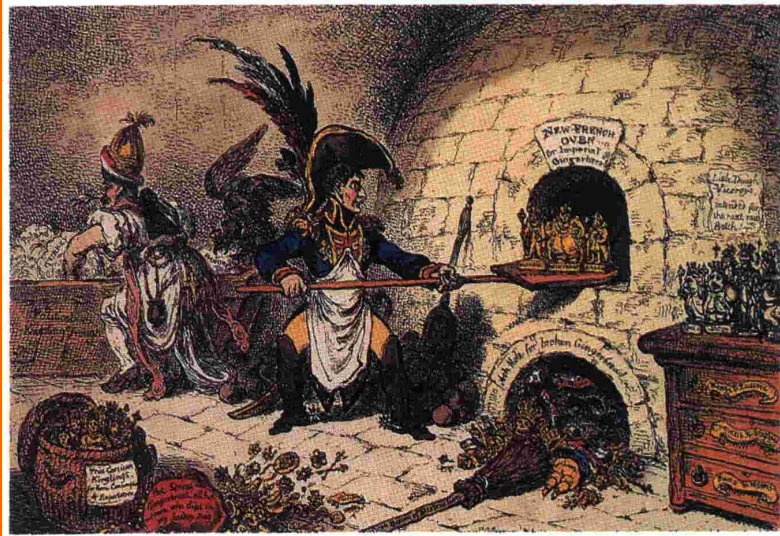
Diese britische Karikatur von 1806 bezieht sich auf die Neuordnung Deutschlands durch Napoleon und heißt: „Ein Kaiser backt Könige und Fürsten“. Im Ofenloch liegen die entmachteten Herrscher, aus dem Ofen kommen gerade die frisch gebackenen Herrscher von Bayern, Baden, Württemberg und Hessen. Weitere Herrscher warten noch ungebacken auf der Kommode rechts.