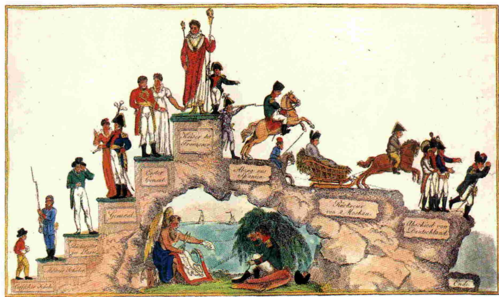
Darstellung des Auf- und Abstiegs von Napoleon