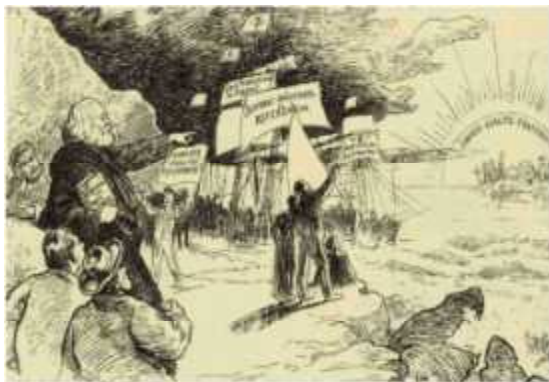
Mit seinem Hauptwerk, dem „Kapital“ in der Hand, weist Karl Marx auf das „gelobte Land“, das hinter schwarzen Wolken leuchtend am Horizont heraufzieht.