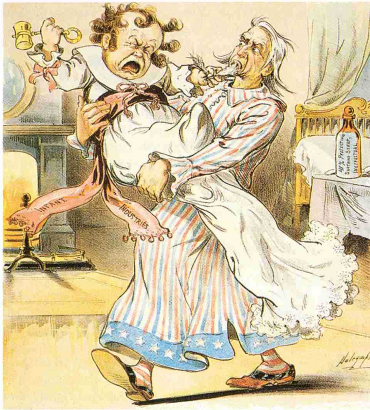
Louis Dalrymple, Das Geschrei der Industrie nach staatlichem Schutz, Karikatur, 1896. – Die Karikatur stammt aus dem Jahre 1896. Uncle Sam ist in der Rolle einer Amme dargestellt, die ein schreiendes Kind zu versorgen hat. Auf dem Kleid des Babys ist zu lesen: „Infant Industries“ (Industriezweige in den Kinderschuhen). Auf der Flasche im Hintergrund steht: 41% Protection (41% Schutzzoll).